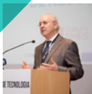
II PAINEL A Economia Portuguesa: Passado e Futuro Rui Rio